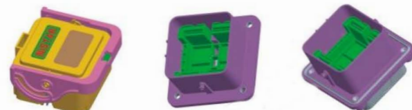
前安装 Front install